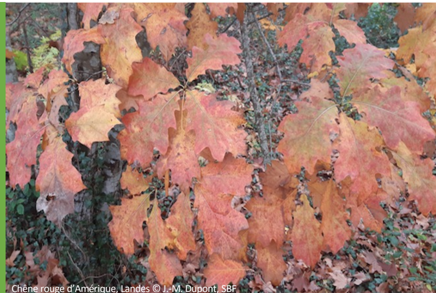
Chêne rouge d'Amérique, Landes

Société nationale d'horticulture de France