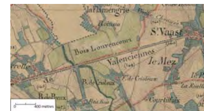
Carte d'état major (1820 - 1866)