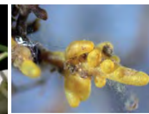
Mycorhize de Russule ocre et blanc